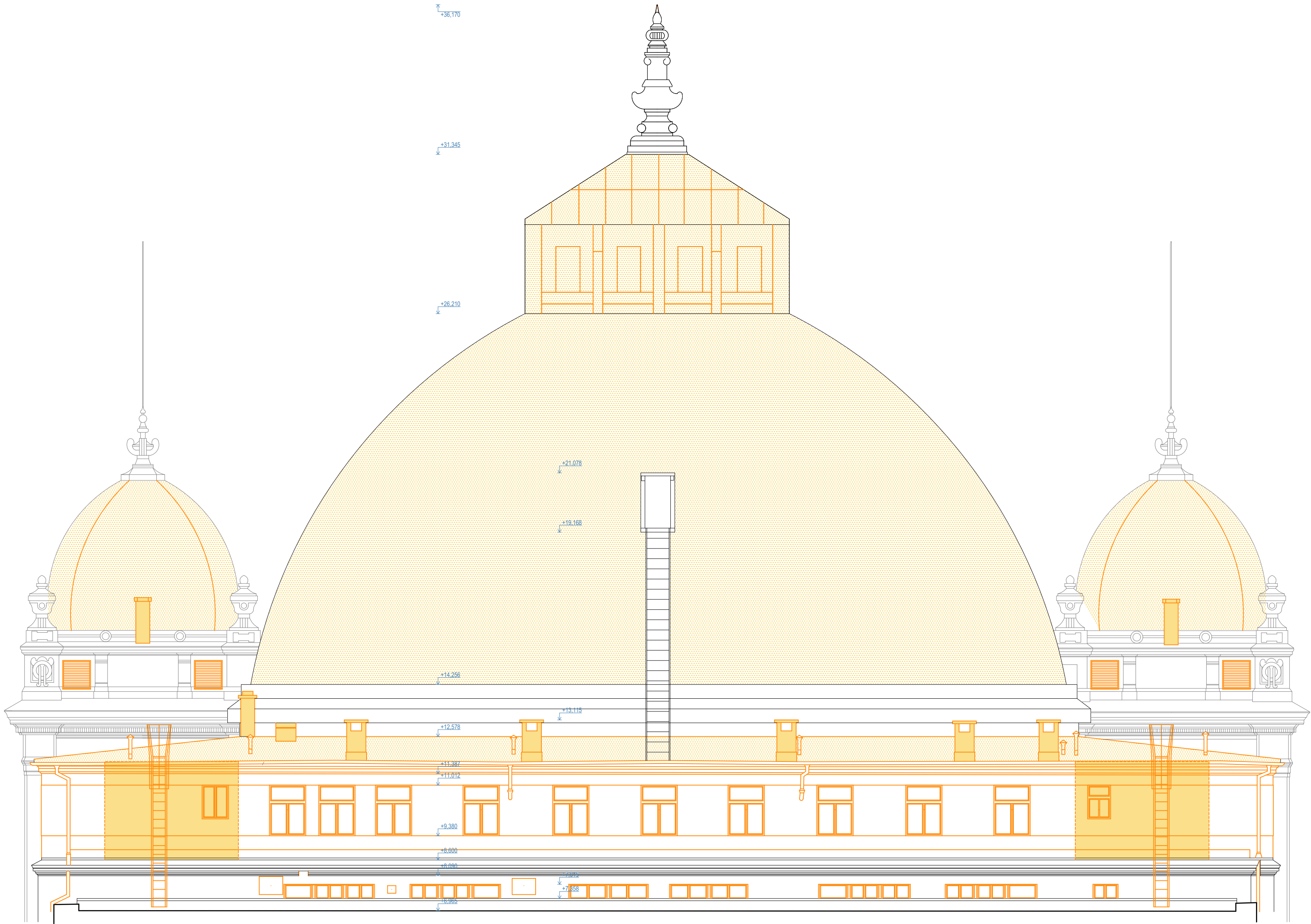
POHLED VÝCHODNÍ - ČÁST B2